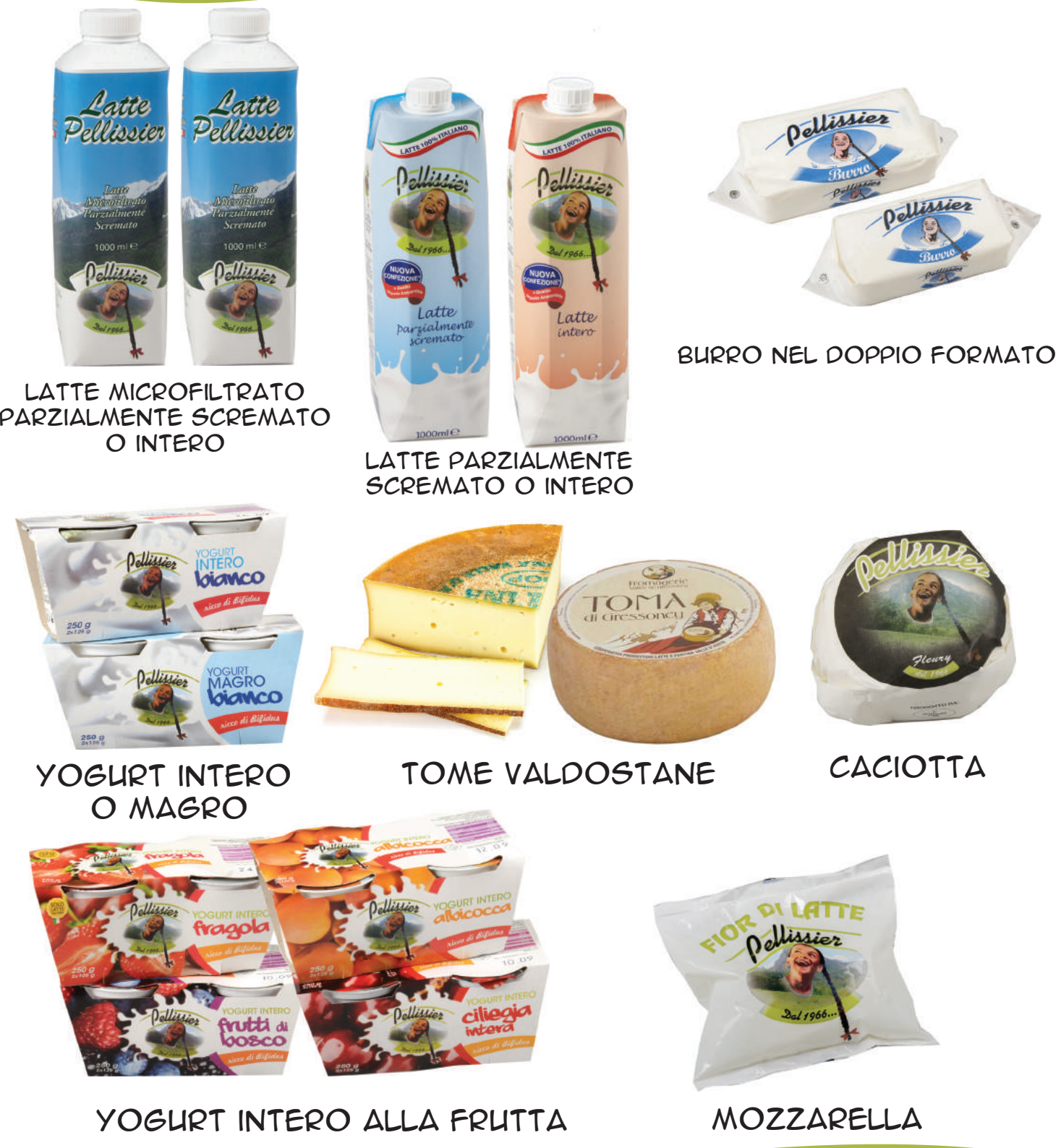
LATTE MICROFILTRATO PARZIALMENTE SCREMATO O INTERO